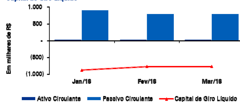
Capital de Giro Líquido

A referida variação resultou na diminuição do déficit em 12% do CGL no período apresentado, sumarizando o montante de R$ R$ 769 mil em março de 2018.